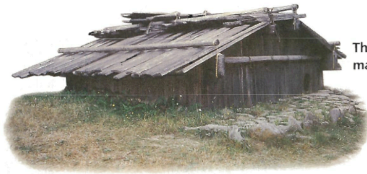
The Hupa in the mountain region made houses out of cedar wood.

加州印第安人住的地方也要適應氣候。氣候(climate)就是一個地方一年當中通常都會有的天氣。Modoc 族住在山區，因為山區的冬天很冷而且會下雪，所以他們需要住在溫暖的房子裏。Miwok 族住在山谷區，他們的房子是用樹枝、樹皮、小樹叢或草蓋成的。住在沙漠地區的 Yuma 族用樹枝和小樹叢來蓋房子，他們也在房子外面包一層泥土和沙子，所以在大太陽底下可以保持涼爽。